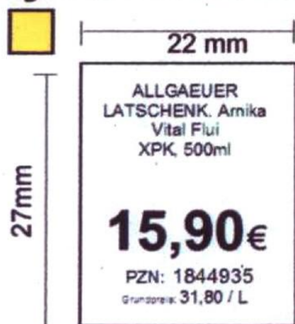
Beispiel für Midi 22x27