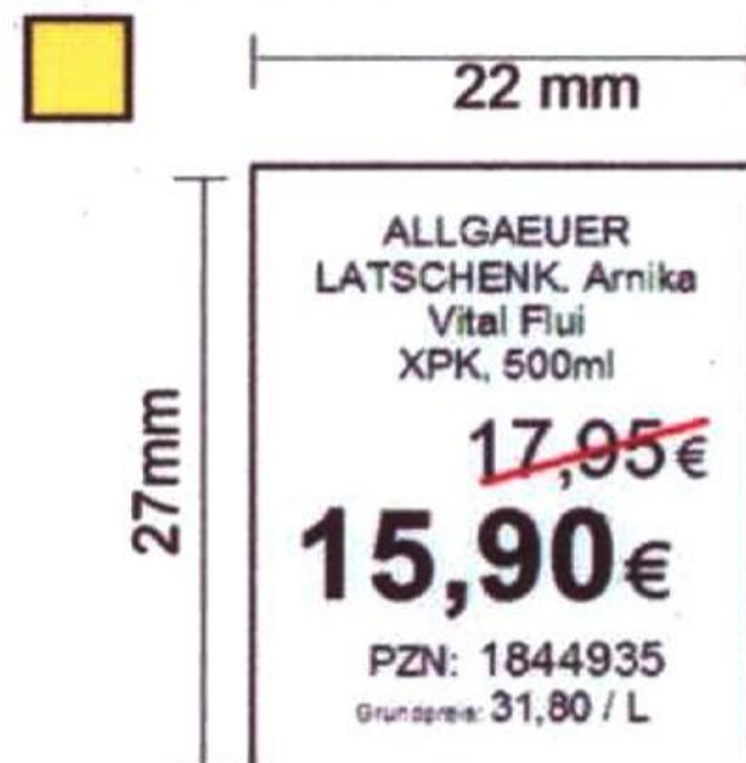
Beispiel für Midi 22x27Aktion